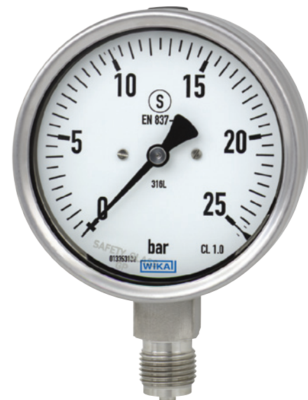
Rohrfederdruckmessgerät Typ 232.30