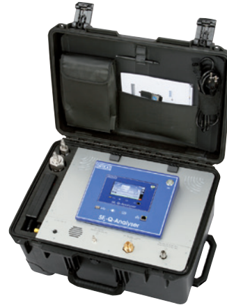
Analysegerät Typ GA11